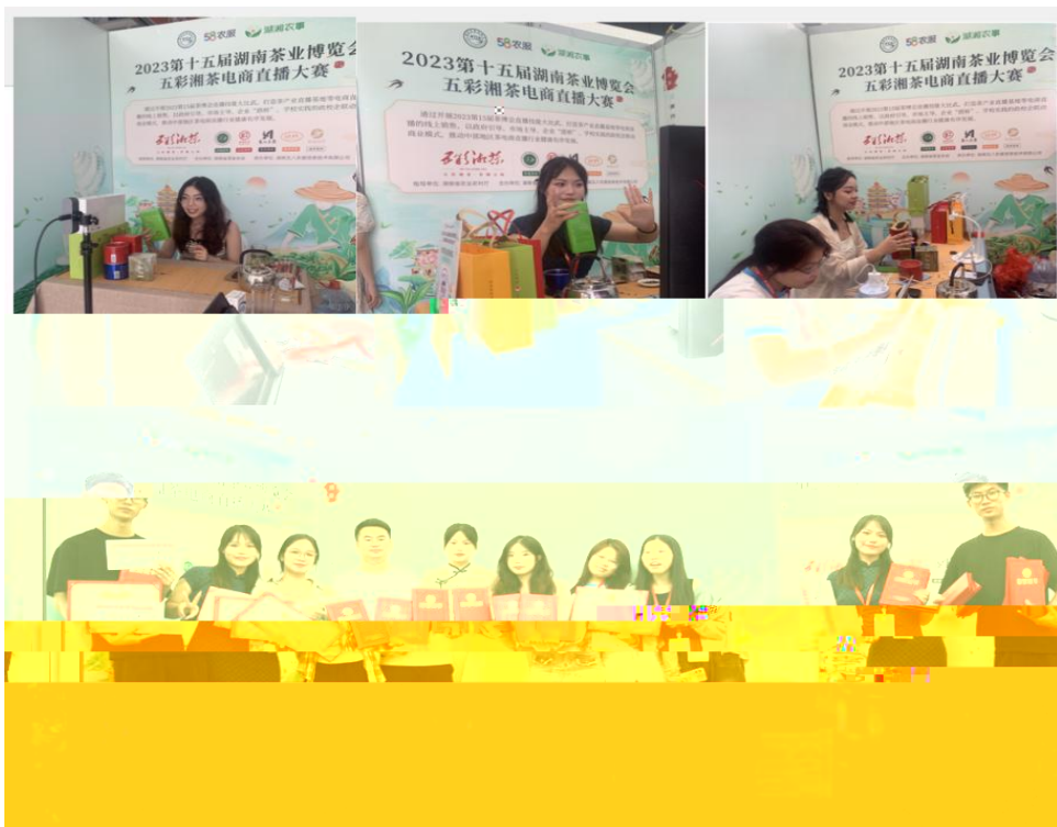
图 “湖南省第十五届茶博会” 电商直播比赛现场

播和方的，短 得的步。 队比 10多单、单， 包但不、等多个，的 和队得的高度。的 得不对公的，更对参 付出和的充分定。