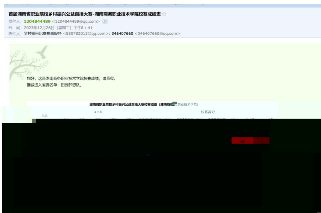
图 湖南商务职业技术学院学生在湖南省首届职业院校乡村振兴直播大赛中获得好成绩

的队。成 的 得不 对 合 方 的 ，更 对公 电 播 导和 操 的 充分 。 过 的 度合 ，公 不 供 的 播 和 ，更 比 搭 才 的 ， 、 供 。