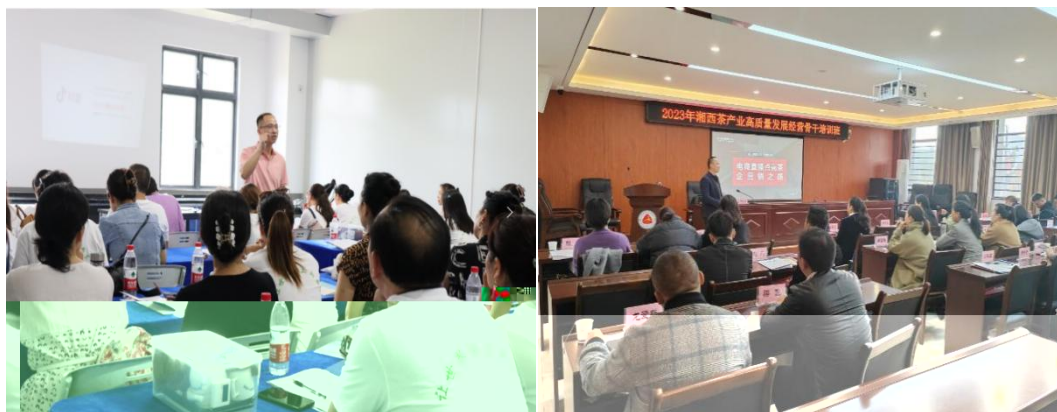
图 企业协助学校为湘西茶企开展电商直播培训

更 对 电 的 。 过 的 ， 茶 得 更 地 电 播的操 、 策 等方 的 ， 电 的 奠定 础。