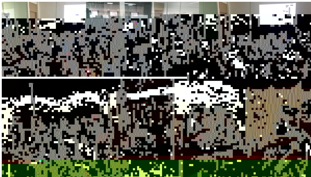
图 特邀企业专家来基地为学生进行专业培训

地 2023 地 ( 2), 供 宝贵的 。 过 的分 , 度 、 场变 , 对电 播 的 。 不 的 储备, 高 操 , 的 发 奠定 础。 措 合 的 度, 地 合 的 。