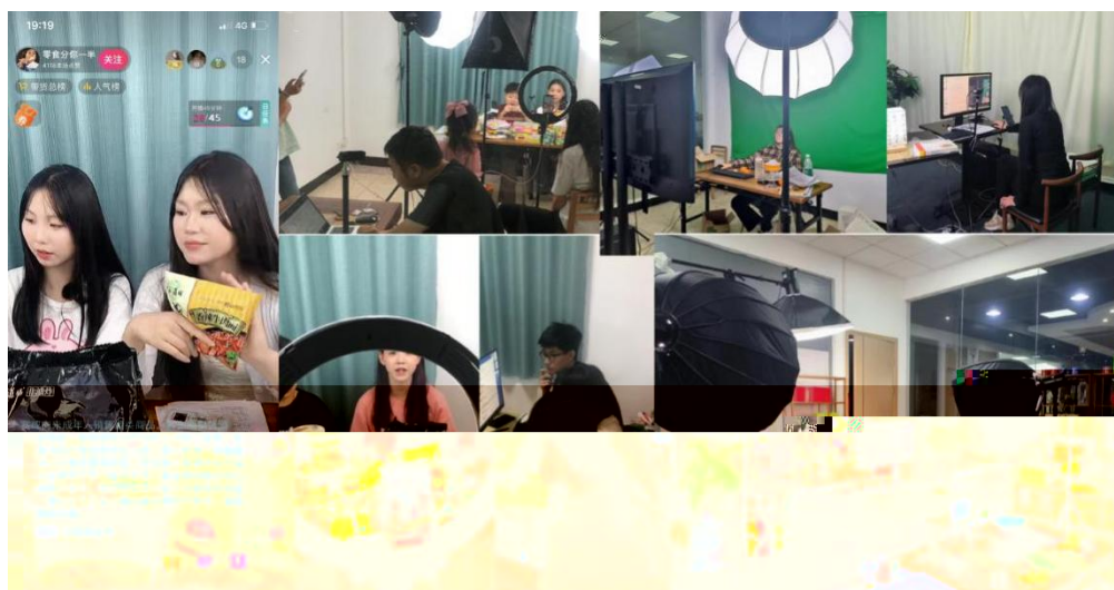
图 组织学生开展实习实训